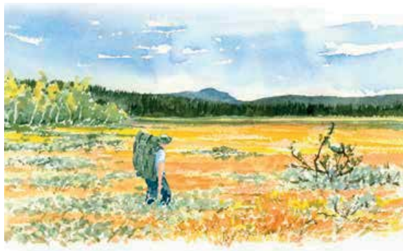
Grandsjömyran med Gitsfjället i bakgrunden