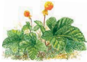
Hjärtrot Rubus chamaemorus

Blaikfjället ligger mellan Malgomajs och Ormsjöns dalgångar. Reservatet sträcker sig drygt 45 km från Sagatun i sydost till Rönnäsmyran i nordväst. Väster om Gransjövägen vidtar Gitsfjällets naturreservat som omfattar allt från själva Gitsfjället till granurskogar och våtmarkernas kronjuvel: Rapsvuome.