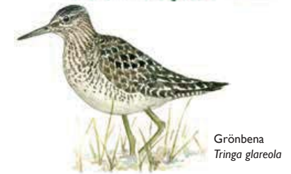
Grönbena Tringa glareola

En mosaik av våtmarker och björkskogsklädda moränkullar och åsar utgör den fjällsänka inom Gitsfjällets naturreservat som kallas Rapsvuome. Området har ett mycket rikt fågelliv och har stor betydelse för häckande vadare. I Rapsvuome häckar myrsnäppa, grönbena, enkelbeckasin, rödbena och många fler.