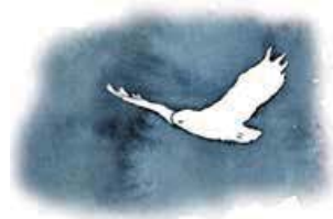
Fjälluggla Bubo Scandicus

Marsfjällets naturreservat innehåller allt från kalvfjäll och fjällbjörkskog i väster till höglänta myrplatåer och urskog i öster. Högfjällsmassivet Marsfjället domineras av den mäktiga, 1 587 meter höga Marsfjällstoppen, högst i södra Lappland. På platån öster om Marsfjället finns ungefär 10 000 hektar myr, som i de östra delarna övergår till skog.