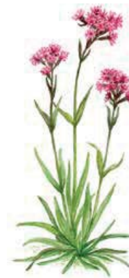
Fjällnejlika Viscaria alpina

Söder om Vojmán vid Kittelfjäll finns rödbruna serpentinmoräner där kal fjällarv växer bland förvidna tallar.